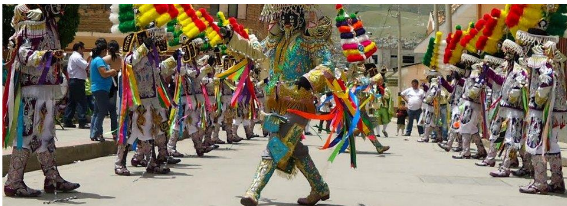
El momento de la COFRADÍA en la Danza de Negritos de Huánuco. Las dos filas de los extremos están integradas por los negros pampas, mientras que al centro bailan los caporales desarrollando las distintas mudanzas de pasos.

Para la COFRADÍA , los negros pampas se disponen en dos filas paralelas, dejando un espacio al centro. En uno de los extremos están los pampas guidores. Al centro se desplazan bailando acompasadamente los caporales, quienes van expresando varias mudanzas, las cuales se consideran al presente doce en total. Entre éstas las más conocidas son el mano a mano, trenzado de rodillas, chicotillos enganchados, corvas enganchadas, el sapo, chicotillos cruzados entre las piernas y el caimán 11 . Las mudanzas ejecutadas por los caporales, son seguidas por los negros pampas. En breve comienzan a circular los corochanos haciendo tronar sus matracas. Lentamente aparecen los abanderados, cuyo paso de danza es distinto, avanzando con breves y suaves saltos. Por último, llegan la dama y el turco, que se desplazan caminando suave y onduladamente, hasta que en la pausa después de las mudanzas de los caporales y negros pampas, bailan una tradicional marinera huanuqueña o un huayno, ajenos a lo que sucede a su alrededor.