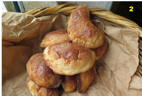
Desayuno tradicional navideño con ponche de huevo, caldo verde, café y empanadas.

En los días de la fiesta, a las 6:00 de la mañana los caporales hacen la llamada del inicio del día, con la banda interpretando una melodía lenta y acompasada, respondida vocalmente por los caporales, con cantos alusivos a Jesús. Es el inicio de la jornada y los negritos, cada uno con su séquito de familiares y gatillines , visitan la casa del mayordomo, donde son recibidos con un sustancioso desayuno. Este consiste un