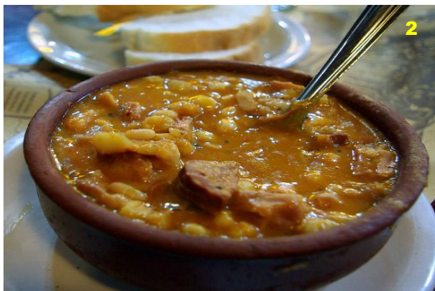
Platillos consumidos durante la Danza de los Negritos. 1. Picante de carne, servido con arroz, mote de maíz y habas a la hora del almuerzo. 2. Loco de gallina, tradicionalmente ofrecido a media tarde durante el baile popular.

A las 2 de la tarde cada cuadrilla se dirige a la casa del mayordomo correspondiente, donde es servido un abundante almuerzo, en el que no puede faltar el picante de carne con arroz, acompañado de fuentes con papas, habas y mote de maíz sancochados. La bebida más empleada es la chicha de maní, que alternativamente puede ser de jora. En