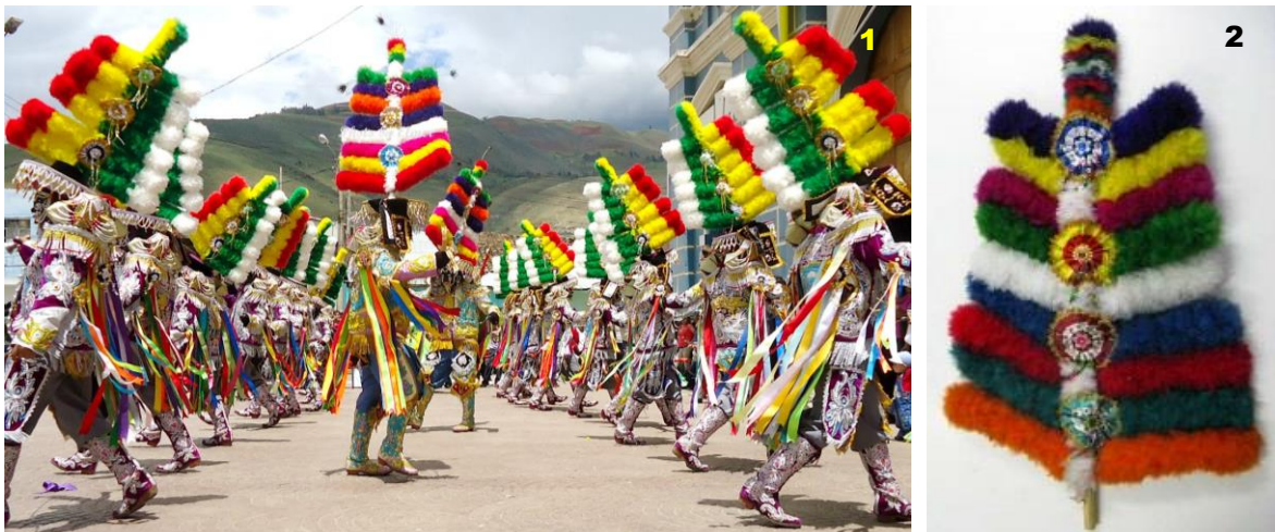
1. Personajes de la Danza de los Negritos en Huánuco: la cuadrilla de negros pampas, formada por 10 a 12 pares de danzantes. Al centro, los caporales que marcan las mudanzas o pasos. 2. Penacho actualmente en uso, con 19 plumeros de vivos colores, que puede alcanzar 1.00 m. de altura.

SEGUNDO GRUPO , compuesto por diversos personajes que representan lo foráneo y dominante, que se insertó en la región con la llegada de los europeos en el último tercio del siglo XVI. Son protagonistas de menor relevancia en la danza, pero imprescindibles en la recreación histórica presentada. Entre éstos se distinguen los siguientes: