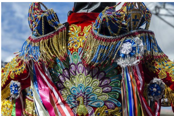
Huánuco, Danza de Negritos. Detalle del saco ricamente bordado, las charreteras con flecos de hilos de pedrería y las cintas de raso multicolor que cuelgan de los hombros.

Al presente, el ropaje ha sufrido una evolución importante a nivel de enriquecimientos visualmente llamativos, que han transformado no solamente a los caporales, sino a los negros pampas en personajes vestidos con un preciosismo a ultranza. Los caporales calzan botas de pana o terciopelo densamente bordadas, pantalones de diversos colores, algunas veces brillantes sobre los que han aplicado tres pares de pañuelos adelante y dos atrás. La camisa sigue siendo blanca, pero la corbata ahora se usa apretadamente bordada. El algodón o saco ha sido colmado totalmente de ricos bordados en hilos de oro, plata y colores diversos, que se extiende a amplias charreteras sobre los hombros que han sido enriquecidas con flecos y filigranas de cuentas. Las cintas multicolores que cuelgan de los hombros, ha sido alargadas hasta la altura de las rodillas. Los rostros siguen cubiertos con máscaras de cuero negro, pero sobre ellas se han aplicado bordados de pedrería, colgantes de perlas a manera de lagrimones o suspendidas del labio inferior, lo que se complementa con un sombrero de cartón, revestido en raso, con aplicaciones de bordados y joyas, que se enriquecen con festones de hilos de perlas que cuelgan del borde del sombrero. Encima de éste, el antiguo penacho de tres plumas ha sido llevado a su máxima expresión, con composiciones de 13 a 19 plumas sintéticas organizadas horizontalmente a manera