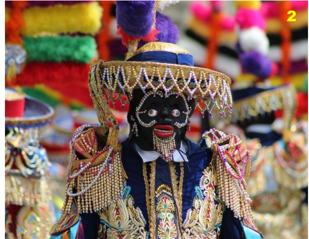
Personajes de la Fiesta de los Negritos en Huánuco: CAPORALES, ricamente ataviados y que se desempeñan como jefes de la cuadrilla de negros.

Al presente, el ropaje ha sufrido una evolución importante a nivel de enriquecimientos visualmente llamativos, que han transformado no solamente a los caporales, sino a los negros pampas en personajes vestidos con un preciosismo a ultranza. Los caporales calzan botas de pana o terciopelo densamente bordadas, pantalones de diversos colores, algunas veces brillantes sobre los que han aplicado tres pares de pañuelos adelante y dos atrás. La camisa sigue siendo blanca, pero la corbata ahora se usa apretadamente bordada. El algodón o saco ha sido colmado totalmente de ricos bordados en hilos de oro, plata y colores diversos, que se extiende a amplias charreteras sobre los hombros que han sido enriquecidas con flecos y filigranas de cuentas. Las cintas multicolores que cuelgan de los hombros, ha sido alargadas hasta la altura de las rodillas. Los rostros siguen cubiertos con máscaras de cuero negro, pero sobre ellas se han aplicado bordados de pedrería, colgantes de perlas a manera de lagrimones o suspendidas del labio inferior, lo que se complementa con un sombrero de cartón, revestido en raso, con aplicaciones de bordados y joyas, que se enriquecen con festones de hilos de perlas que cuelgan del borde del sombrero. Encima de éste, el antiguo penacho de tres plumas ha sido llevado a su máxima expresión, con composiciones de 13 a 19 plumas sintéticas organizadas horizontalmente a manera