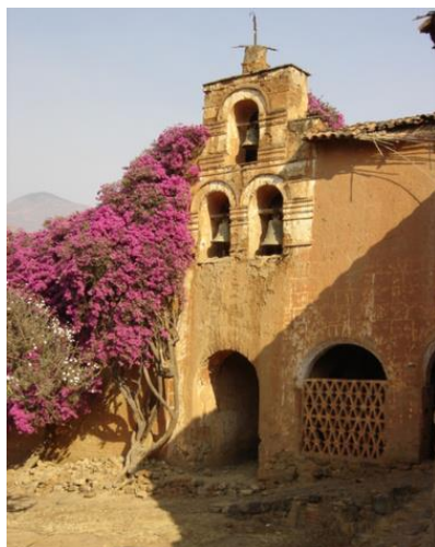
Huánuco: antigua hacienda de Andabamba. La tradición señala que aquí tuvo inicio el baile de negritos durante la época colonial, si bien no ha podido ser documentalmente demostrado.

El 25 de diciembre es el día central de la fiesta. Por la mañana las danzas de los Negritos concurren al campo deportivo para retarse y competir. Por la tarde el Niño Jesús es llevado en procesión a recorrer las calles del poblado. La competencia entre grupos de danzantes se detiene y surge el recogimiento espiritual, manifiesto en oraciones y cánticos al Mesías que acaba de nacer. En los días siguientes prosiguen las celebraciones, destacando los diversos regalos que los pobladores hacen a los procuradores, entre los que hallan cerdos y terneros, que se preparan para las comidas de esos días, así como la elección de los procuradores que deberán organizar la fiesta para el año siguiente. Por su valor de expresión inmaterial, la originalidad de su coreografía y de su música, así como de su contenido identitario, ha sido declarada como Patrimonio Cultural de la Nación el 27 de febrero de 2009 (RDN 286/INC-2009).