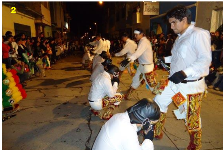
Danza de Negritos. 1. Caporal sin pastorina en la danza de la DESPEDIDA . 2. Caporales y negritos sin pastorinas , algodones, chicotillos, en el momento final de quitarse las máscaras.

Imágenes: 1. http://goo.gl/iqrxiv y 2. http://goo.gl/PPgTZV [Consulta: 12.12.2015]