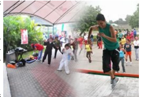
Mix de actividades: Danza, aeróbicos, atletismo.

La Organización Mundial de la Salud, recomienda realizar 30 minutos diarios de actividad física, así contribuiremos a tener una comunidad más saludable.