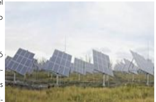
Seguidores solares, del centro de innovación aplicada en tecnología.