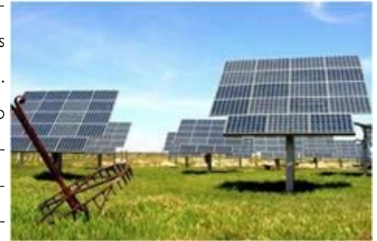
Paneles soales perpendiculares a los rayos solares