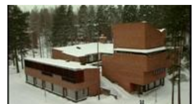
Saynatsalo Town Hall

Fue concebido como un laboratorio experimental para poner a prueba las filosofías de la construcción y la arquitectura, como los sistemas de cimentación, de forma libre construcción de ladrillo, y la calefacción solar pasiva. Dado que el edificio era propio riesgo financiero de Aalto y sólo sirvió como residencia a tiempo parcial, la casa es lúdico y expresivo en su ejecución.