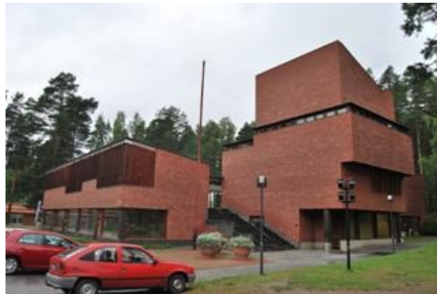
Ayuntamiento de Säynätsälö. Jyväskylä. 1952