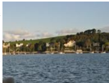
Eco Isla al sur de Gran Bretaña

Los datos adquiridos por los satélites indican que la concentración de dióxido de nitrógeno en las capas más bajas de la atmósfera ha disminuido en la última década sobre Europa y los Estados Unidos. Por un lado, el mayor uso de combustibles fósiles por parte de las economías en desarrollo provoca un aumento en los niveles de contaminación; por el otro, las mejoras tecnológicas tales como los automóviles ecológicos son las responsables de la disminución de los niveles de contaminantes", explica Andreas Richter, un científico del Instituto de Física Ambiental de la Universidad de Bremen, Alemania.