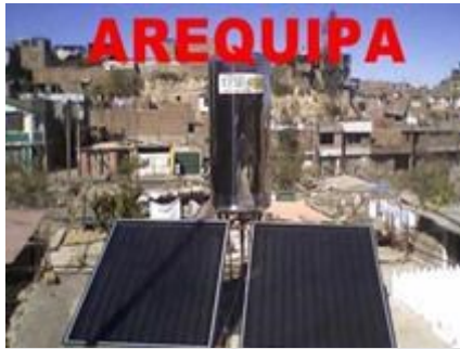
Las termas solares en Arequipa y el sur del país son una grata realidad.

(termas solares) y aplicarlo en las edificaciones que se están promoviendo para diversificarlas energéticamente.