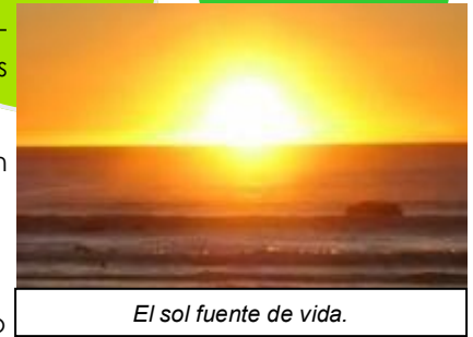
El sol fuente de vida.

El sol ha sido la forma de medir el tiempo, los días, meses, años fueron medidos con el sol en calendarios, utilizándolo luego de forma pasiva para obtener mejores condiciones de cosechas, para obtener bienestar en las edificaciones, es decir, que en función al aprovechamiento de esta energía se han organizado siempre las comunidades humanas en todo el orbe.