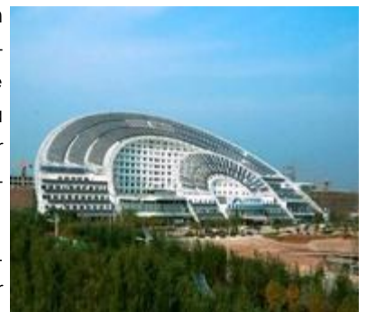
Edificio con abastecimiento energético solar, el más grande el mundo en Dezhou, China.

En el país, se cuenta con un potencial de 5Kwh/m2 promedio, lo cual es un recurso importante que es factible de ser aprovechado de forma fotovoltaica (para generar electricidad), de forma de calentamiento de agua