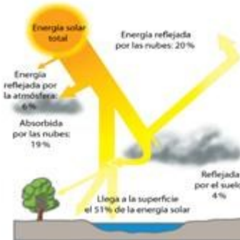
Solo la mitad de la energía solar llega a la tierra.

Por ello, desde siempre los seres humanos han tenido la necesidad de aprovechar o controlar el sol como recurso de vida, es decir, utilizaron el sol para poder convivir adecuadamente en el ambiente, para poder sembrar y cosechar, para poder cobijarse del calor o frío; logrando desarrollar con el paso del tiempo unas soluciones arquitectónicas y urbanas que manejaban con una adecuada disposición de sus volumetrías, materiales y orientaciones, así como también manejaron su vida en función del sol y las estaciones.