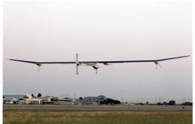
El avión Solar Impulse despegando del aeropuerto Moffett Field de la NASA, en Mountain View, California.

Desde Phoenix, el avión volará a Dallas-Fort Worth, en Texas; al aeropuerto Lambert-St. Louis en Misuri; al aeropuerto Dulles en Washington y al John F. Kennedy en Nueva York, con escalas de 10 días en cada ciudad. La nave es alimentada por 12.000 celdas fotovoltaicas que cubren sus enormes alas y cargan sus baterías.