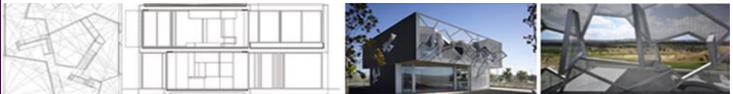
CASA ZAFRA- UCEDA

La Casa Levene está ubicada en San Lorenzo El Escorial, Madrid, España, tiene un área de 400 m2 y fue construida en el 2006. Busca un mayor respeto por las cualidades naturales del lugar, se adapta el edificio al espacio dado por los grupos de árboles de los bosques existentes. La estructura tira de la casa hacia atrás, creando un sistema de fuerzas que emulan a una garra que divide la construcción en tres brazos que se presentan volados. Tiene un revestimiento de basalto traído de Mongolia. En el interior, la vivienda se convierte en un juego. Gran parte de la zona superior se destina al ocio, y se compartimenta gracias a grandes tabiques móviles. En este espacio lúdico, de paredes recubiertas con una resina epoxi, predomina el amarillo. Los epoxis suelen usarse en capas de imprimación, tanto para proteger de la corrosión como para mejorar la adherencia de las posteriores capas de pintura.