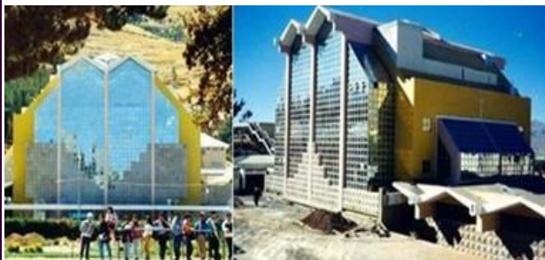
Biblioteca de la UNAP