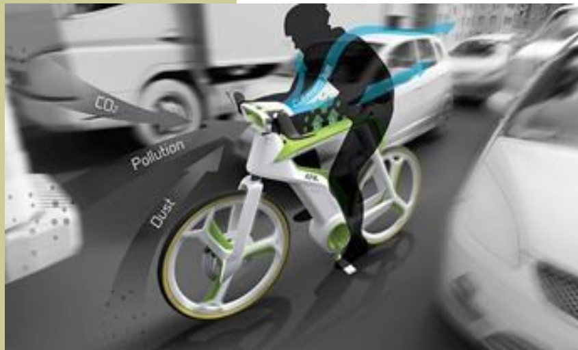
DISEÑO DE BICICLETA

La bicicleta no sólo se ha convertido en un medio de transporte cotizado por traer beneficios a la salud, sino por ser amigable con el medio ambiente. Siguiendo esa línea, diseñadores en Bangkok, Tailandia, se encuentran trabajando actualmente en la que sería la primera bicicleta que, al igual que las plantas, a través de fotosíntesis permitiría convertir el aire contaminado en aire puro. Esta bicicleta funcionaría a través de un método que está siendo aún perfeccionado. En teoría, su marco de aluminio se convertiría en un 'sistema de fotosíntesis' que genera oxígeno a través de una reacción entre el agua y la energía eléctrica de una batería de iones de litio.