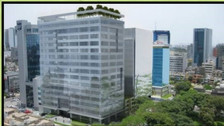
El Centro Empresarial Platinum Plaza, ubicado en San Isidro, fue el primer edificio corporativo verde en el Perú.

La norma “va a hacer que el mercado despegue”, confía Kristtian Rada, líder del programa de ciudades y gobiernos para América Latina y el Caribe de la Corporación Financiera Internacional (IFC), parte del Grupo Banco Mundial. Rada trabaja junto a la Cámara Peruana de la Construcción (CAPECO), el Ministerio de Vivienda y la Cooperación Suiza en la promoción de la certificación sostenible Edge para viviendas con interés social. “En el Perú es necesario romper el mito de que la construcción sostenible es cara, sino que es un buen negocio, no es un privilegio, sino una oportunidad que puede masificarse siendo accesible”, remata.