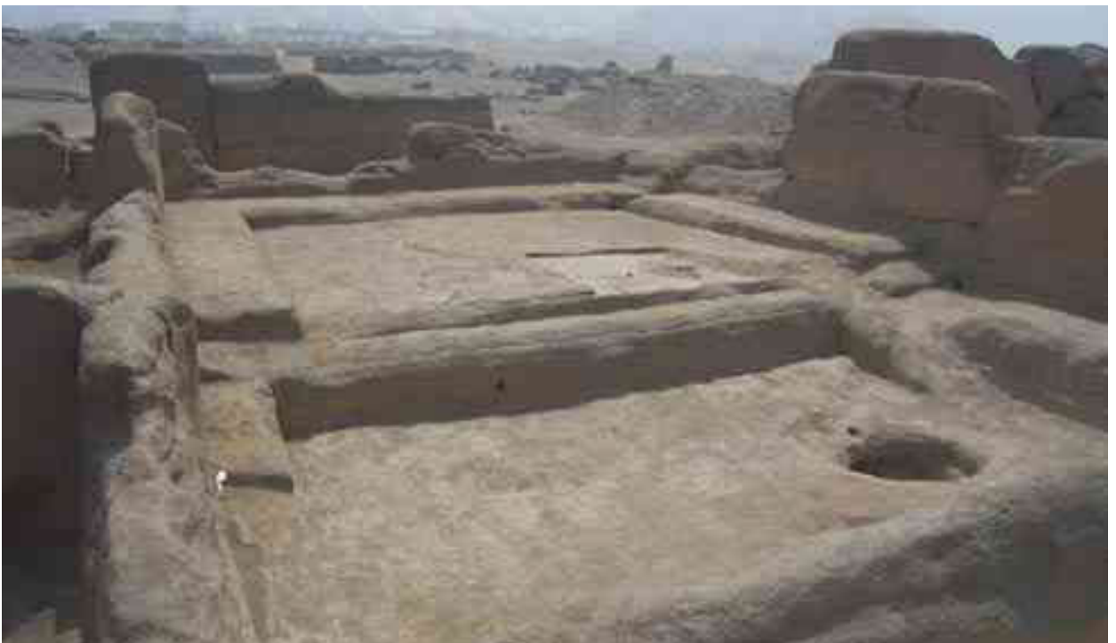
Ambiente que presenta una banqueta con rampa lateral de posible uso administrativo.

“Los pobladores son realmente los usuarios directos de los beneficios, son los usuarios directos de la grandeza del sitio y son los principales comprometidos con que su entorno sea mejor. Vivir cerca de un sitio arqueológico es un privilegio y se convierte realmente en una fuente de esperanza y en una fuente de riqueza”.