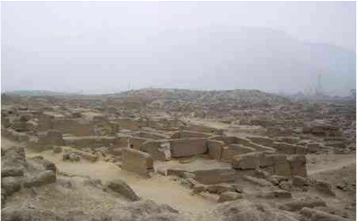
Cajamarquilla, la inmensa ciudad de barro. A simple vista parece un laberinto de muros de tierra, pero está formada por varias pirámides y recintos amurallados.