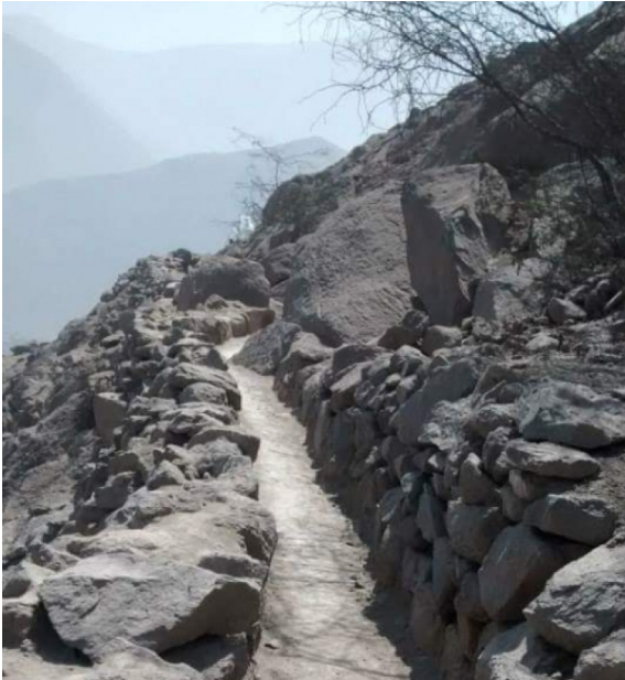
El sendero que facilita los desplazamientos de los caminantes existe y amerita ser mejorado, ensanchándolo y vistiéndolo de verde las laderas a ambos lados del camino.

La ruta de trekking en mención será ampliada, reforestada, dotada de la debida señalización y señalética; se le tornará segura para cuyo fin se acondicionarán parapetos de piedra y barro, tipo tapial, se le dotará de miradores y bancas con techo de paja para el descanso, la observación y la meditación, la habilitación de “tambos” donde se expendan refrescos de diversas frutas, helados y diversos platos, preparados por damas del entorno del proyecto, debidamente entrenadas.