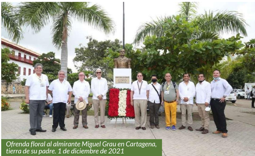
Ofrenda floral al almirante Miguel Grau en Cartagena, tierra de su padre. 1 de diciembre de 2021

Desde poco después de terminada la convención en Arequipa comenzaron las conferencias virtuales en las que cada país participante se hacía presente con algún tema relacionado a sus monedas, billetes, medallas o condecoraciones. Esto, además de ampliar el corpus de conocimiento, estrechó las relaciones entre los miembros y los países participantes que ya pasan de 22.