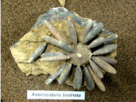
Echinoideo del Eoceno de Marruecos

El presente año, se continuó con el convenio con el Museo Paleontológico “Meyer Hönninger, con la adición de muestras correspondientes al Eoceno, una multitud de erizos, anfibios, reptiles, aves y mamíferos, se unen a la exposición de la evolución de la vida en nuestro planeta, estas últimas muestras, reflejan la similitud de estos vertebrados en el registro fósil de Alemania, los sedimentos