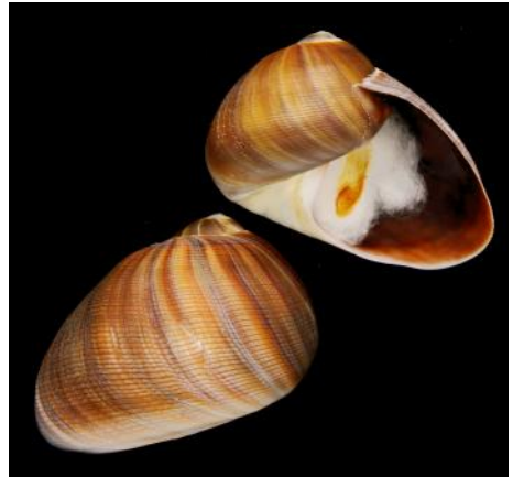
El Sinum cymba conocido como Abalón, se alimenta perforando el caparazón de otros moluscos

Entre las variadas formas alimenticias y estrategias que presentan los gasterópodos, existen algunas que desafían la imaginación, frases como "Caracoles cazadores de peces" o "Perforadores de Conchillas"