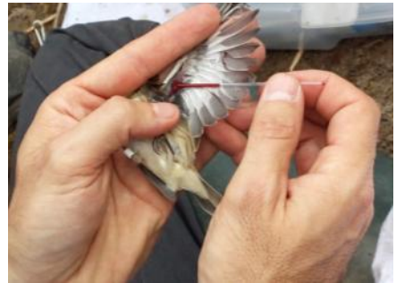
Extracción de muestras de sangre en campo.

Los contenidos tratados versaron sobre la investigación de la malaria aviar, incidiendo en la importancia de su estudio como herramienta de la sostenibilidad ambiental y sus efectos debido al cambio climático, resaltando igualmente el valor de la información que nos proporcionan dichos estudios para la gestión de recursos naturales y evitar desastres como la aparición y propagación de Enfermedades Infecciosas Emergentes. Varios días se dedicaron a trabajo de campo,