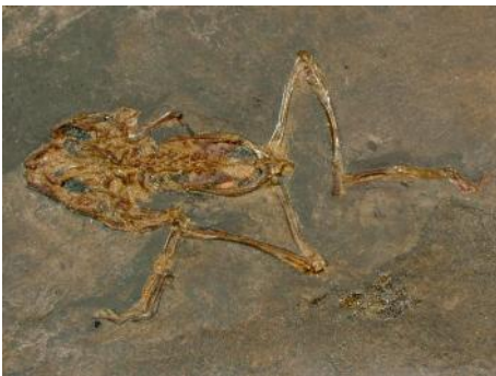
Propolodytes wagneri , un anuro del Eoceno de Alemania

El presente año, se continuó con el convenio con el Museo Paleontológico “Meyer Hönninger, con la adición de muestras correspondientes al Eoceno, una multitud de erizos, anfibios, reptiles, aves y mamíferos, se unen a la exposición de la evolución de la vida en nuestro planeta, estas últimas muestras, reflejan la similitud de estos vertebrados en el registro fósil de Alemania, los sedimentos