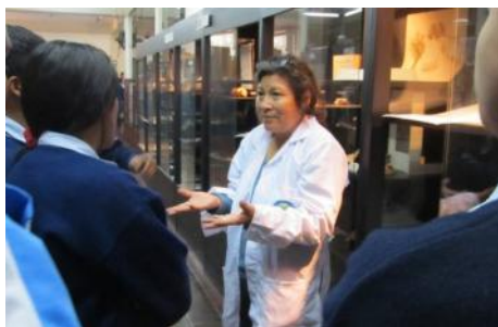
La Directora del Museo, explicando sobre las plantas a los alumnos visitantes