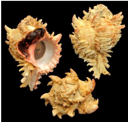
Ejemplar de Phyllonotus regius , muricido predador.

su poderosa rádula para perforarlos caparazones de sus víctimas, formando agujeros casi perfectamente circulares por donde introducen jugos digestivos para luego extraer el contenido ya licuado.