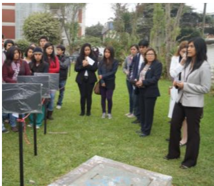
El pre-estreno de nuestra dinámica “La Línea del Tiempo”, protagonizada por los alumnos de la facultad de Biología

En este año, la “Línea del Tiempo”, una dinámica inspirada en la historia de la Tierra, desde su origen, hace unos 4500 millones de años, hasta la actualidad; esta nueva dinámica, entusiasmó a los alumnos de los diferentes colegios visitantes, ya que mediante la competencia pudimos comprobar la comprensión del guiado en Paleontología.