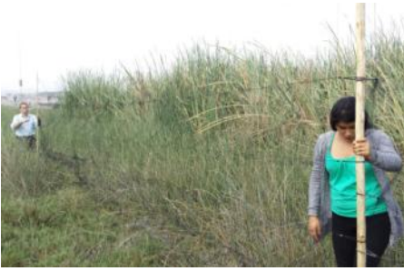
Izamiento de las redes de neblina

de los parásitos como uno de los principales impactos en la biodiversidad animal (Moreno 2005). La Organización Mundial de la Salud considera que la deforestación y el calentamiento global acarrearán una mayor incidencia de enfermedades como la malaria, afectando a millones de organismos, incluidos seres humanos. Más de 500 especies de malaria parasitan a anfibios, reptiles, aves y mamíferos de todos los continentes. Importantes avances médicos como el desarrollo de quimioterapias y medicamentos antimaláricos, estudios de epidemiología o investigaciones inmunológicas son desarrollados en modelos de malaria aviar.