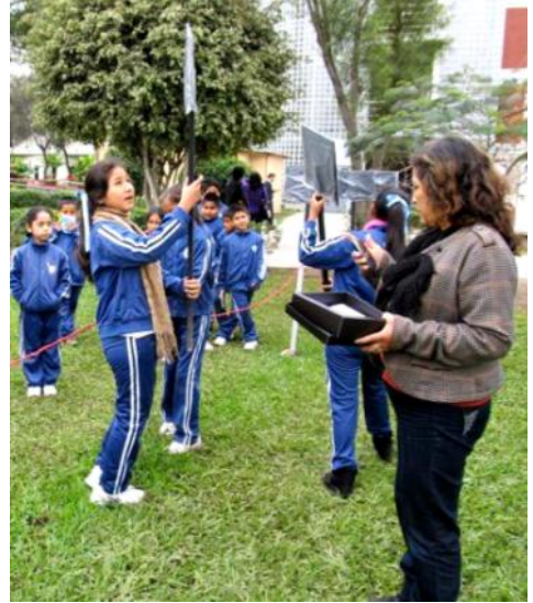
La Directora del Museodurante la puesta en escena de la dinámica "La Línea del Tiempo "

Para complementar el aprendizaje en la visita, se implementó una dinámica de competencia, con los datos expuestos por los guías, dos equipos de alumnos visitantes, seleccionados por sus compañeros, compiten para colocar en orden las eras geológicas, plantas y animales tratadas durante su visita, la dinámica entusiasmó a los alumnos, ya que no sólo recibirían, si no que podrían aplicarlas al final de la visita