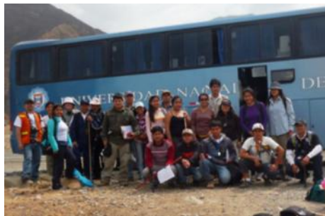
Participantes del Simposio Nacional de Paleontología del Perú, organizado por el INGEMMET