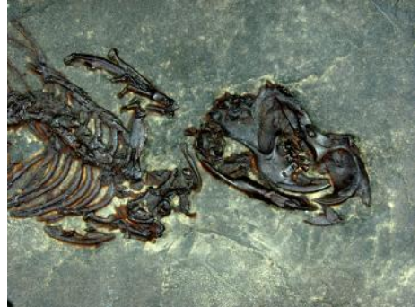
Espécimen de roedor Massillamys .

donde yacen, tuvieron que ser preparados especialmente para disminuir al máximo su deterioro