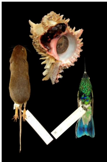
Especímenes preparados para colección científica

Para que puedan ser depositadas dentro de la colección de referencia, deben cumplir los requisitos mínimos de permisos del Ministerio de Agricultura, presentación de una copia del proyecto de investigación y estar conservadas de forma adecuada.