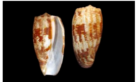
Ejemplar de Conus geographus , Caracol toxogloso

En otros casos, la rádula se adapta y de tener varias decenas de miles de dientes, se reduce a apenas unos quince; los Conidae, los dientes de su rádula se modificaron de tal forma, de asemejarse a arpones, lo que les permite cazar a sus principales presas, los peces; cada diente está lleno de un veneno, la conotoxina, que puede ser letal incluso en el hombre, por lo que el suborden de estos caracoles se denominan Toxoglossos, los que incluyen a las Terebras y la Tacheria mirabilis con su curiosa forma angulosa espiralada.