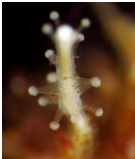
Ejemplar de Coryne cf. exhimia (2,3 mm). Colectado en un embarcadero de Pucusana

En este último caso, se reportaron algunas Chrysaora plocamia en fase medusa, pero no en las cantidades que se observaron en 2012; además, no se tuvieron noticias sobre muertes de vertebrados superiores marinos, como en la ocurrencia de 2012, teniendo en aspecto un panorama bastante normal; los especímenes colectados fueron conservados y depositados en el Museo de Historia Natural “Vera Alleman Haeghebaert” para posteriores estudios.