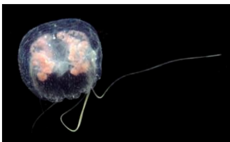
Especimen de Pelagia noctiluca , una especie que normalmente no se presenta en aguas peruanas.

La aparición de una especie en particular, la Pelagia noctiluca , y el registro de hidrozoos coloniales en los incrustantes de diversas embarcaciones, posiblemente del género Coryne , podrían ser vestigios del calentamiento de las aguas del año anterior.