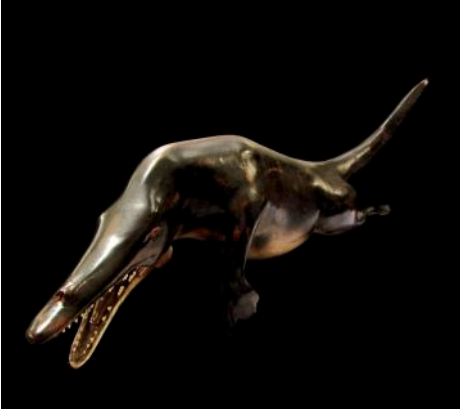
Reconstrucción de Georgiacetus actualmente en exposición

con la adquisición de una maqueta de un antepasado de las ballenas, el Georgiacetus , una ballena cuadrúpeda que vivió apenas hace unos 40 millones de años, la reconstrucción, hecha por el José Pickling, muestra parte de la evolución de los cetáceos, cuando éstos empezaban no sólo a ser completamente acuáticos, si no al trasladar sus orificios nasales desde la punta del hocico, hacia el tope de la cabeza; Georgiacetus es un intermedio, ya que los orificios respiratorios se encuentran en el medio de la mandíbula superior, en pleno tránsito a su posición actual.