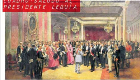
CUADRO: SALUDO AL PRESIDENTE LEGUÍA