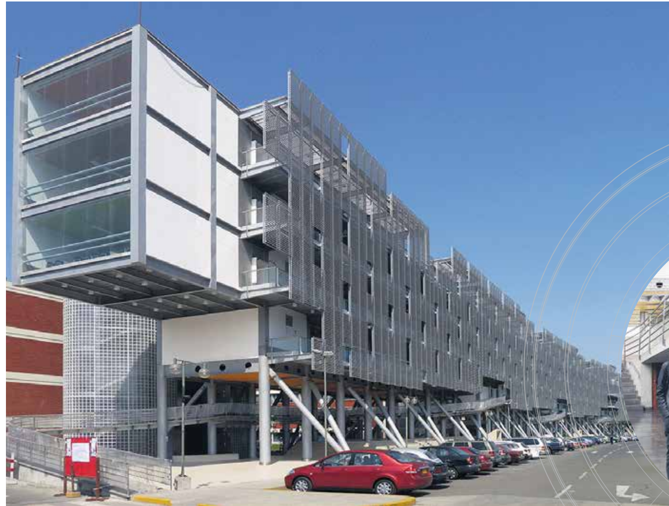
AULARIO 104 Es el edificio de la URP que se luce por su especial diseño arquitectónico.